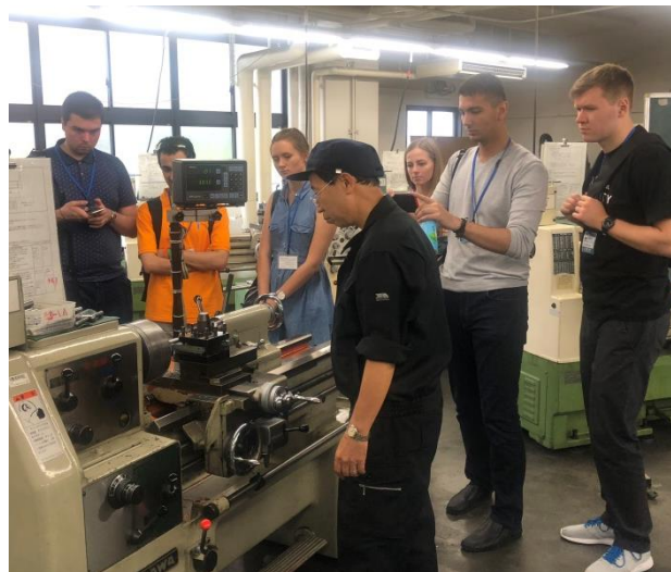
前回の受入時、華道部、企業訪問にて